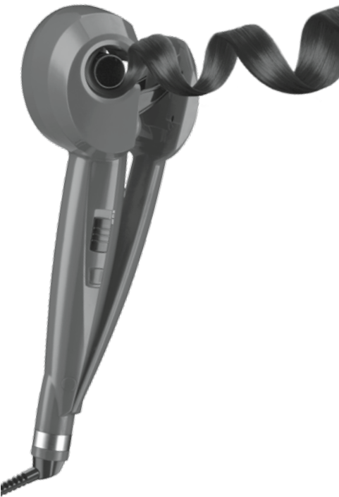
Instruction & Styling Guide Model C910CL

One or more of the following United States Patents: D717,000; 8,607,804; 8,869,808; 8,651,118; 8,733,374 and other U.S. and foreign patents pending